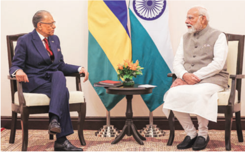
Prime Minister Narendra Modi with his Mauritius counterpart Navinchandra Ramgoolam during a bilateral meeting in Varanasi on Thursday

Indian and Mauritian delegations also signed seven agreements to strengthen bilateral ties after their talks led by the Indian PM and his Mauritian counterpart in Varanasi, the Lok Sabha constituency of